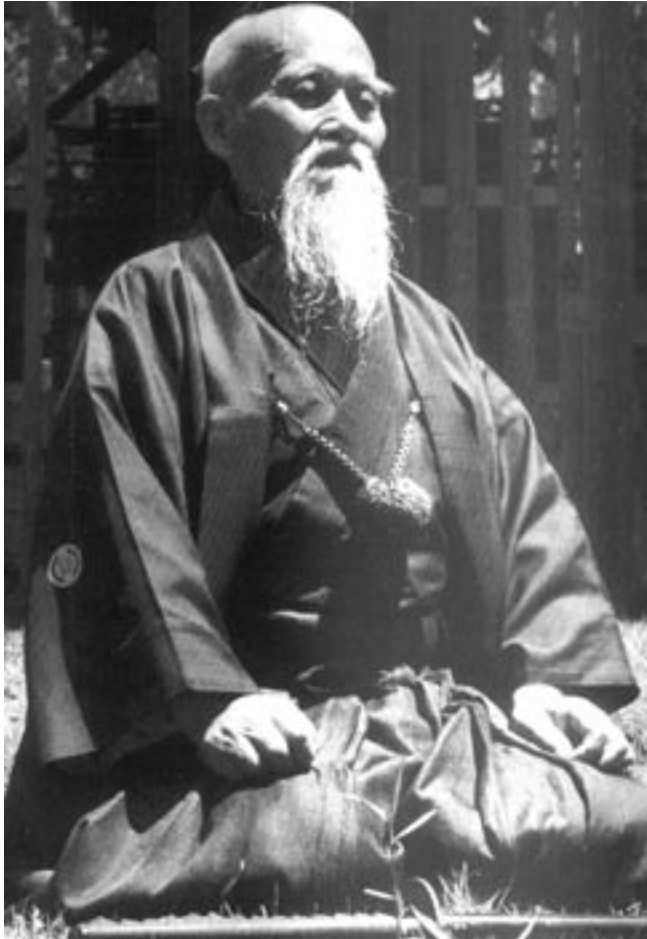
O Sensei Morihei Ueshiba Fondateur de l'Aïkido

“ L'exercice dans le sens de la voie (do dans l'aïkido par exemple) est un travail sur le corps dans sa fonction la plus naturelle. La répétition du mouvement dans le but d'une amélioration toujours renouvelée, outre qu'elle donne à chacun l'espoir et la chance de pouvoir toujours faire mieux, permet très vite de retrouver un équilibre et une relation harmonieuse entre le corps et l'esprit, entre sa propre personnalité et l'extérieur “.